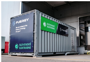
Müller Textiles .....▶ 432 kWh 499 kWp (1. fáza)