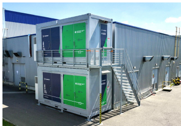
Hanon Systems 864 kWh 970 kWp