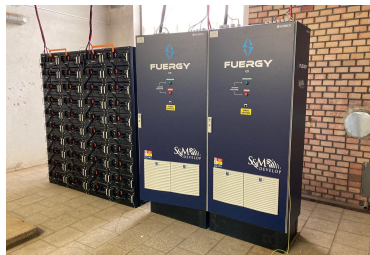
S & M CZ 216 kWh 343 kWp