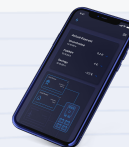
trAlid by FUERGY Automatizované intraday obchodovanie pre výrobcov energie