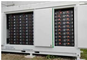
Eissmann 432 kWh