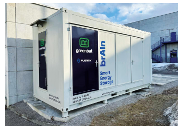
Yanfeng Slovakia 432 kWh 250 kWp