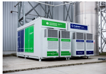
Audia Plastics 864 kWh