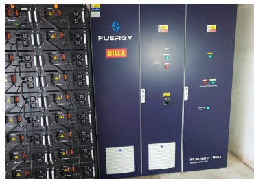
BILLA 108 kWh