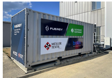
Müller Textiles +432 kWh + 500 kWp (2. fáza)