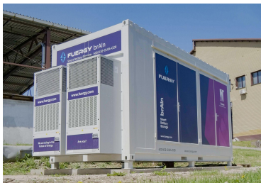
Termonova 432 kWh