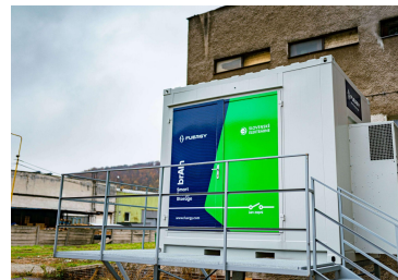
MRAZIARNE Servis 216 kWh 400 kWp