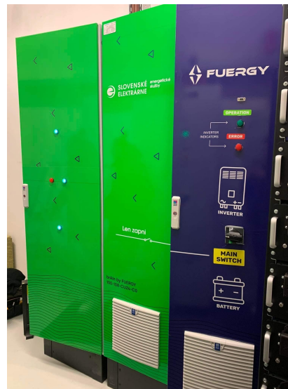
OC Galéria 108 kWh