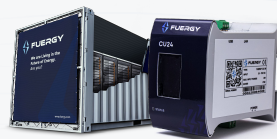
brAln by FUERGY Smart batériové úložisko